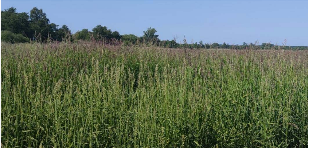
Abbildung 1: Rohrglanzgras