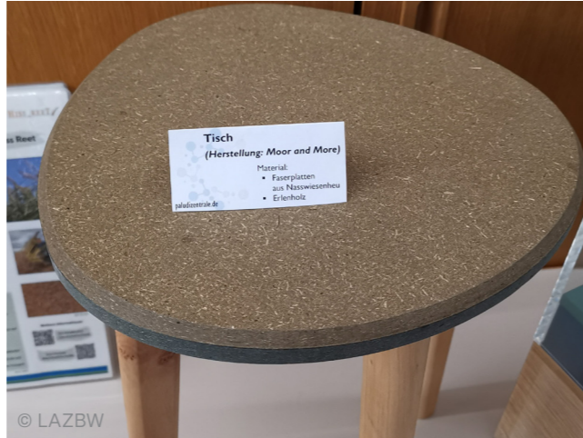
Abbildung 2: Tisch von paludizentrale.de. Herstellung: Moor and Moore. Faserplatten aus Nasswiesenheu, Tischbeine aus Erlenholz.

Momentan werden unterschiedliche Möglichkeiten der stofflichen Nutzung getestet und entwickelt, beispielsweise für die Herstellung von Verpackungen, Papier oder Dämmplatten. Dabei ist vor allem das heterogene Material herausfordernd. Die Aufwüchse eignen sich außerdem gut für die Herstellung von Biokohle. Zum jetzigen Zeitpunkt befinden sich die Absatzwege noch im Aufbau.