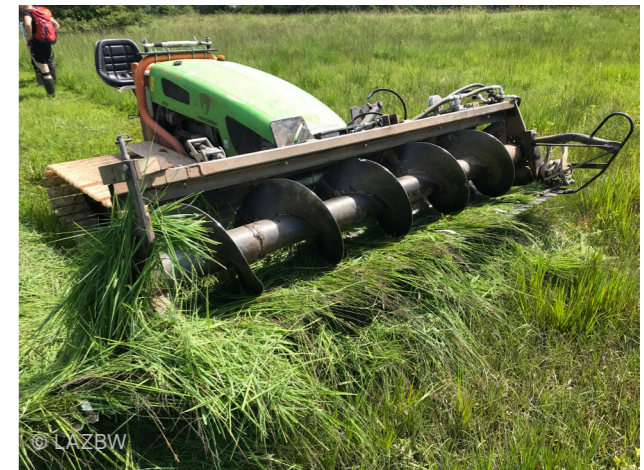
Abbildung 1: Gerät aus Eigenbau mit Messerbalken und direkt anschließendem Schwaden.

Die Erträge können sich je nach Bewirtschaftungsart und Standort stark unterscheiden und liegen bei Jahreserträgen von 2 - 12 t TM/ha.