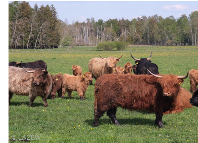
Abbildung 1: Wasserbüffel im Pfrunger Ried

Ein täglicher Besuch bei den Tieren, um eine Gesundheitskontrolle durchzuführen, ist vorgeschrieben. Außerdem sollten Mineralstoffeimer und Lecksteine jeder Zeit verfügbar sein. Da auf Moorböden Selen oftmals ein Mangel darstellt, sollte Mineralfutter mit hohem Selenanteil verwendet werden.