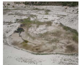
Rohboden und natürlicher Bewuchs