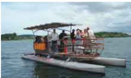
Ein See-Erlebnis der besonderen Art. Gleiten Sie mit der Solarfähre leise über das Wasser, und tauchen Sie ein in die Vogelwelt am Untersee.

Spürsinn macht die Umweltbildung nun für Sie erlebbar. Mit „Spürsinn – Umweltbildung für den westlichen Bodensee“ ist es uns gelungen, die Umweltbildner in der internationalen Bodenseeregion zusammenzuführen.