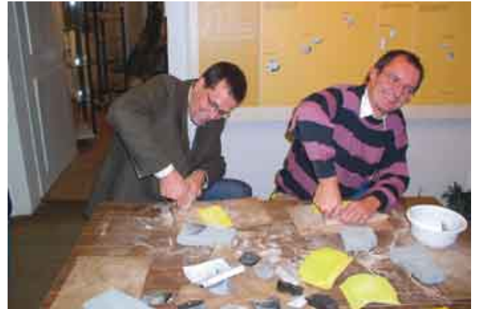
Mit Feuerstein und Schleifsteinen Speerspitzen herstellen: Mit unseren Museumspädagogen können Sie arbeiten wie in der Steinzeit. Wer sagt da noch, Museen seien langweilig!?

Wir vermitteln Ihnen rund 200 Umweltbildungsangebote, nennen Ihnen interessante Lernorte und spüren für Sie Gruppenübernachtungen auf – und dies einfach schnell und kostenlos.